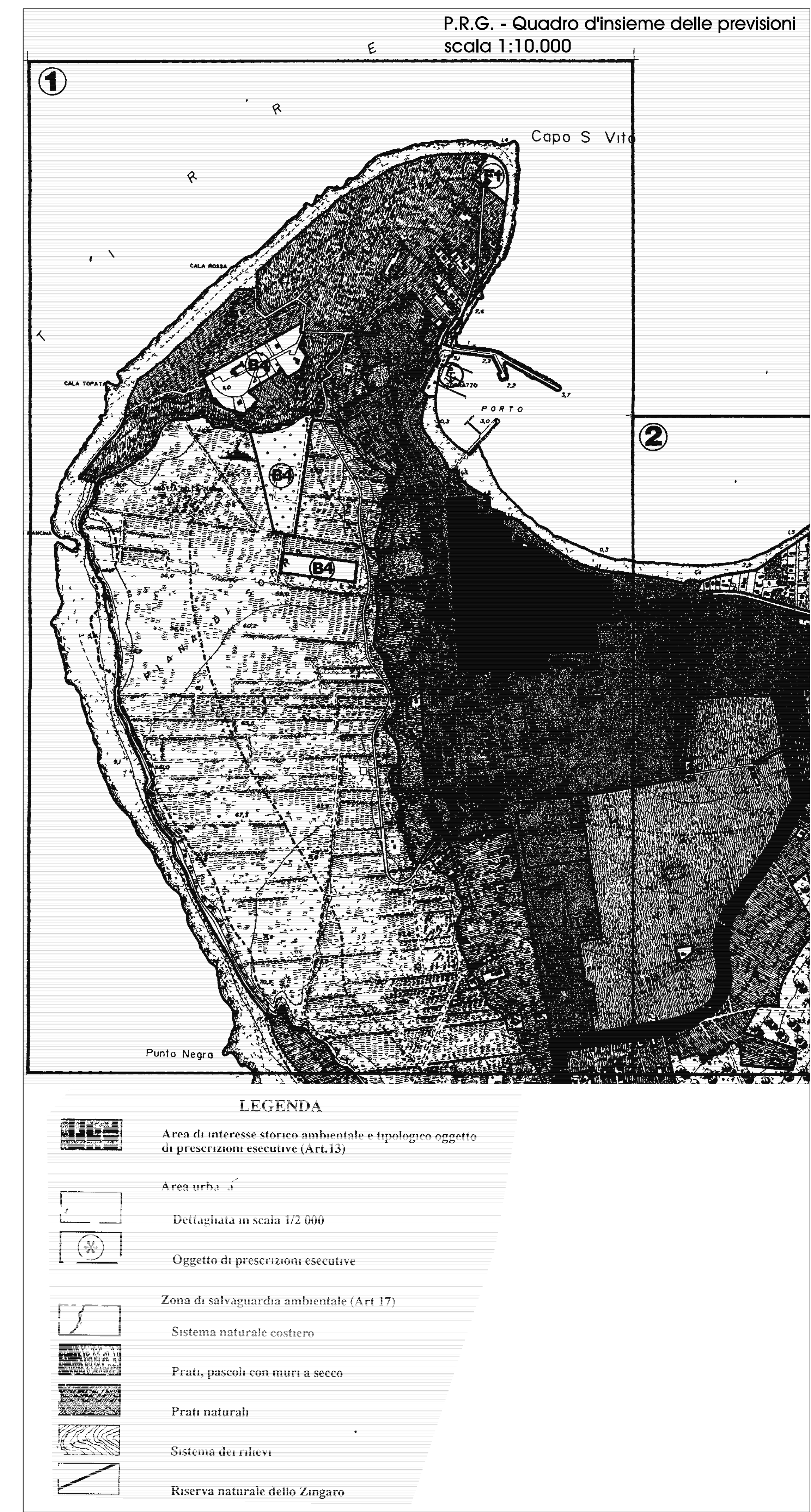
P.R.G. - Quadro d'insieme delle previsioni scala 1:10.000