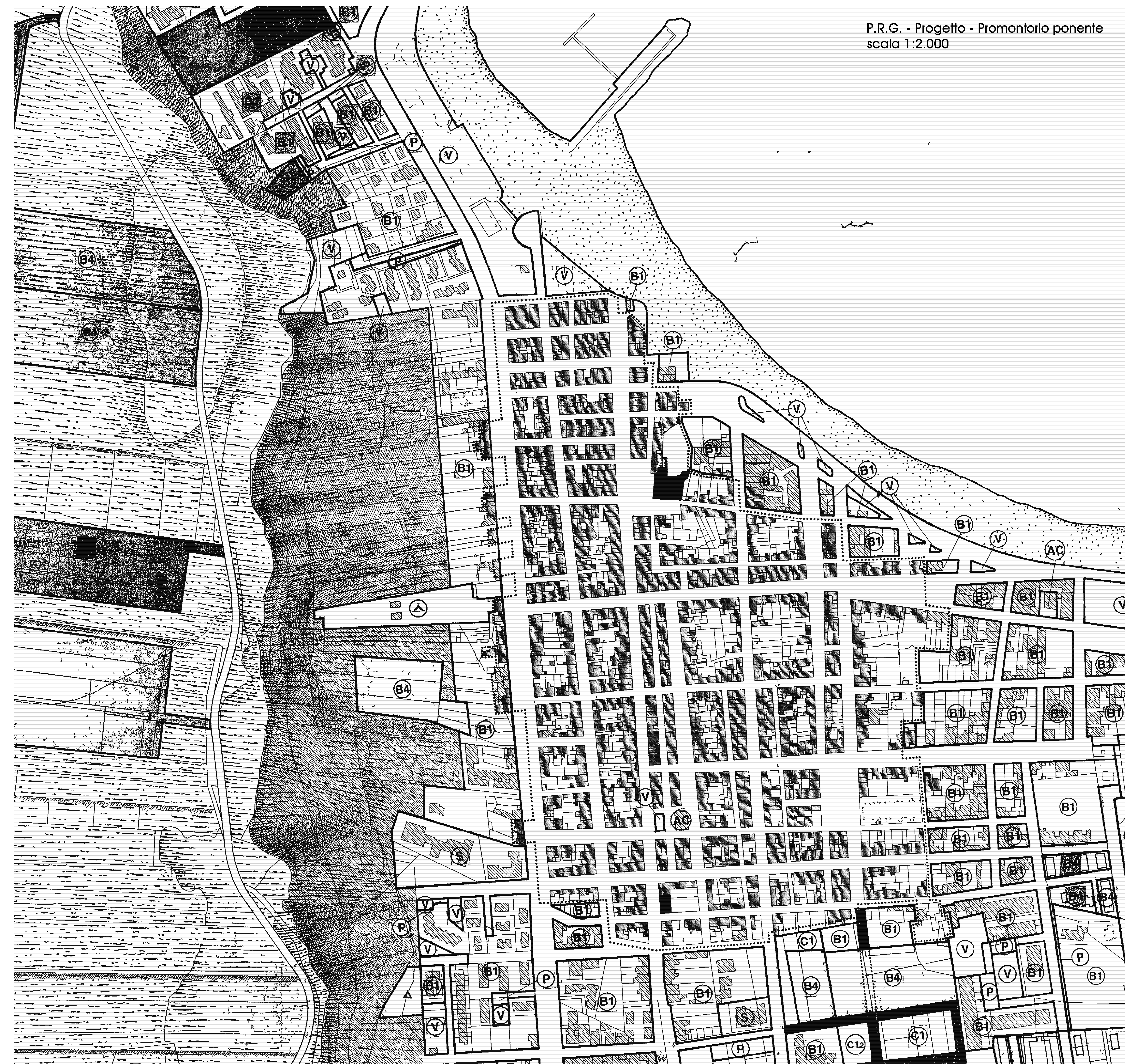
P.R.G. - Progetto - Promontorio ponente scala 1:2.000